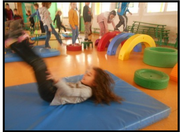
Je fais une roulade avant sur le tapis.